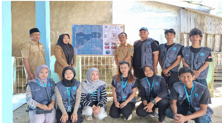
Gambar 2. Pemasangan Peta Pemetaan Potensi Desa

Pada foto yang terdapat di peta potensi mencakup simbol-simbol yang berisi tempat fasilitas kesehatan, tempat fasilitas pendidikan, tempat ibadah, dan kantor desa. Peta potensi Desa Pasauran Kecamatan Cinangka Kabupaten Serang menampilkan berbagai informasi mengenai kondisi wilayah serta persebaran fasilitas umum yang ada di desa tersebut. Pada peta terlihat batas wilayah Desa Pasauran yang disajikan dalam bentuk citra wilayah dengan skala 1:10.000 serta dilengkapi koordinat kantor desa, sehingga memudahkan dalam mengetahui posisi geografis desa tersebut.