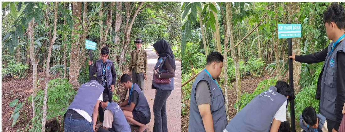
Gambar 1. Pemasangan Plang Pembatas antar Dusun

pemerintah desa. Keberadaan plang pembatas dapat meningkatkan kemudahan akses informasi lokasi, baik bagi masyarakat lokal maupun pendatang, seperti wisatawan, kurir pengiriman, maupun tamu dari instansi pemerintahan. Dengan adanya identitas wilayah yang jelas, proses pencarian alamat menjadi lebih cepat dan akurat sehingga meminimalkan kesalahan lokasi. Selain itu, plang pembatas dusun juga berperan dalam memperkuat identitas wilayah dan rasa memiliki masyarakat terhadap lingkungan tempat tinggalnya. Setiap dusun memiliki identitas yang lebih jelas sehingga dapat meningkatkan kesadaran masyarakat dalam menjaga kebersihan, keamanan, dan keteraturan wilayahnya. Dari sisi tata kelola pemerintahan desa, keberadaan plang pembatas juga membantu perangkat desa dalam mempermudah pendataan administrasi wilayah, seperti pendataan penduduk, distribusi bantuan sosial, serta pelaksanaan kegiatan pembangunan yang berbasis wilayah dusun.